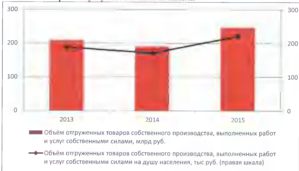
График 1П. Динамика отгруженных товаров собственного производства, выполненных работ и услуг собственными силами