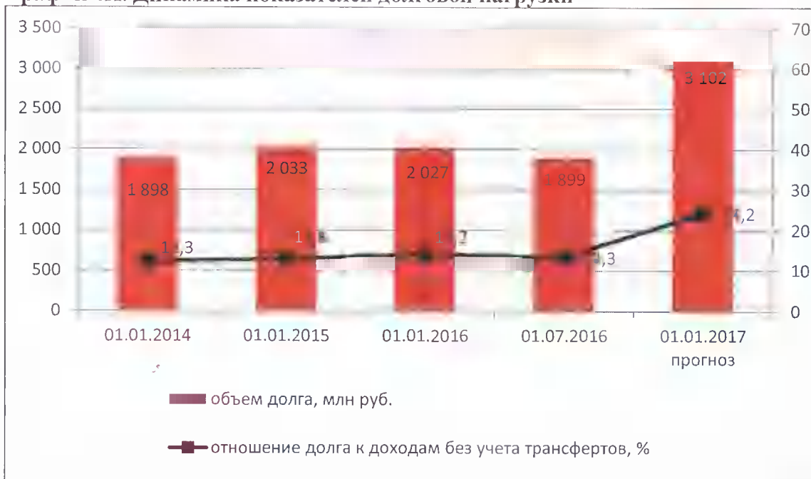
График 4П. Динамика показателей долговой нагрузки