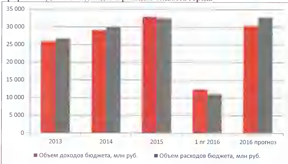
График 3П. Динамика доходов и расходов бюджета города